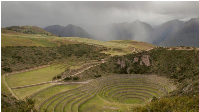
AGRADECIDOS POR SU DIFUSIÓN Área funcional de Comunicación e Imagen Institucional